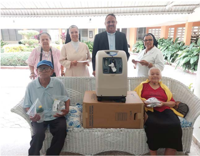
CENTRO GERIÁTRICO SAN JUAQUIN Y SANTA ANA