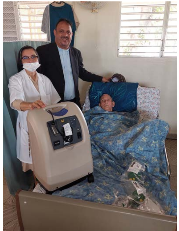
HOGAR DE ANCIANOS SANTISIMA TRINIDAD