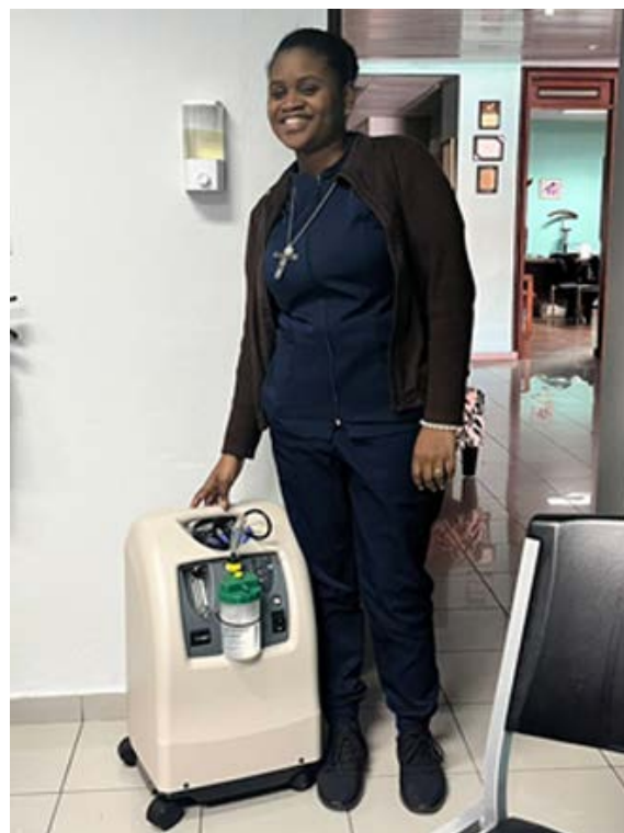
CASA ARQUIDIOCESANA MARIA DE LA ALTAGRACIA