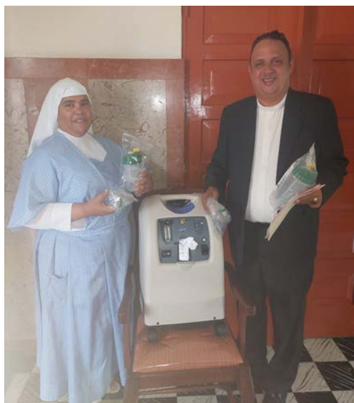
SIERVAS DE MARIA STO DGO.