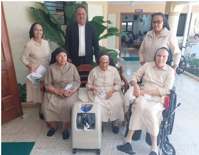
HERMANAS DE LA CARIDAD DEL CARDENAL SANCHA