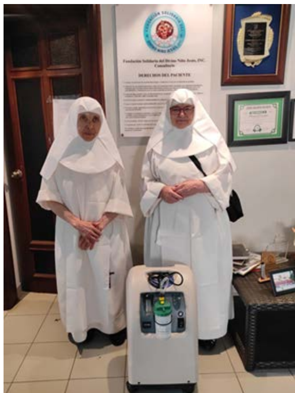
HOGAR DE ANCIANOS MARGARITA HERRERA-JARABACOA