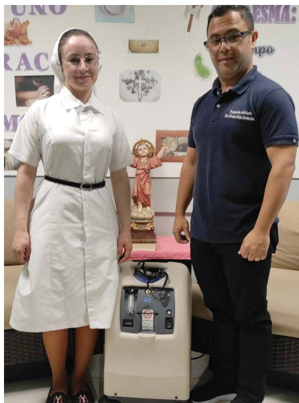
HOSPICIO SAN VICENTE DE PAUL

Gracias a la contribución de un donante de Direct Relief hemos podido apoyar varias instituciones en el país: Hospicio San Vicente de Paúl, Hospicio San José, Siervas de María en Santiago, la Vega y Santo Domingo. Hospicio San Joaquín, la Vega, Hermanas Carmelitas en Santiago, Santo Domingo, La Vega y Mao. Otros centros de personas de la tercera edad en: Dajabón, San Francisco de Macorís, La Romana, El Seibo, Higuey, Jarabacoa y otros centros; han recibido un equipo nuevo de Concentrador de Oxígenos para ayuda de los pacientes con dificultades respiratorias.