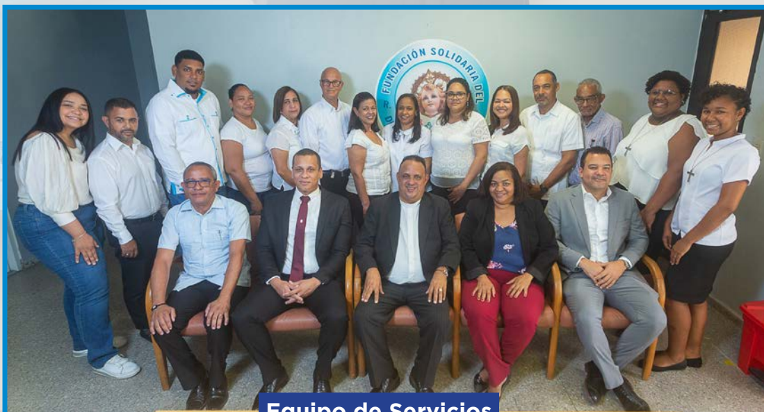
Equipo de Servicios