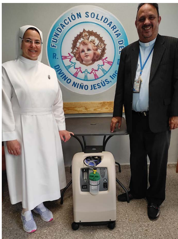
HOSPICIO SAN JOSÉ DE LA MATAS