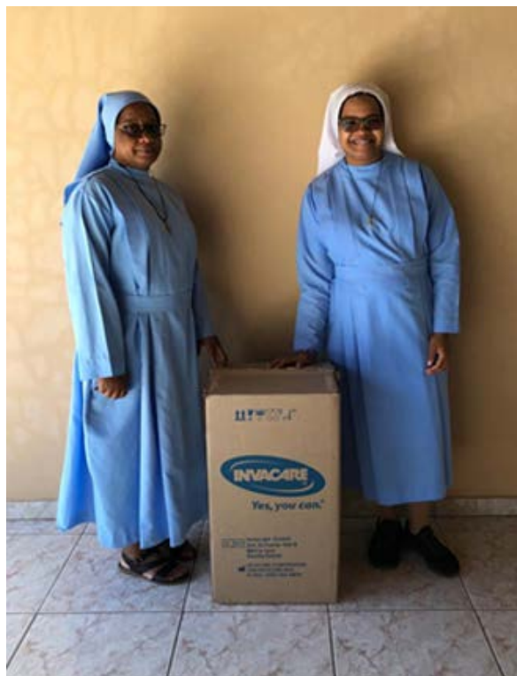
PRÉSTAMO A LA CASA SACERDOTAL DE MATANZAS